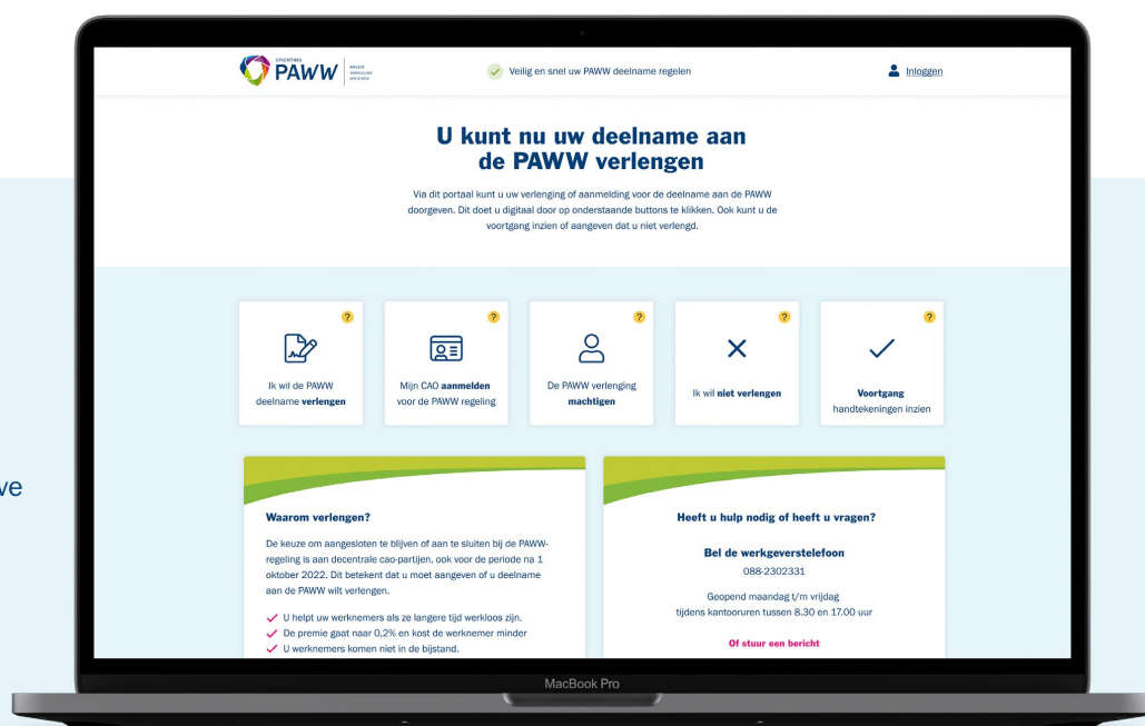
Figuur 2. Een weergave van website van Stichting PAWW.

Wilt u niet verlengen? Dat kan via het portaal dat begin november '21 beschikbaar is. Of u informeert ons via aangetekende post.